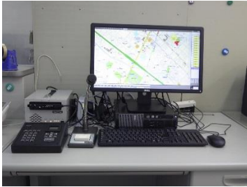
I P無線機 親機 本社営業所 （平成28年7月1日開局）

これにより、異常気象、事故、車両故障など緊急事態発生時の連絡、現場位置の把握、及び迅速な対応をすることが可能となりました。