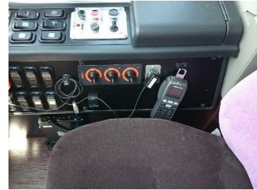
I P無線機 車載器 写真

・違反事項2については、平成28年2月1日付で、運行管理規程を一部改定致しました。